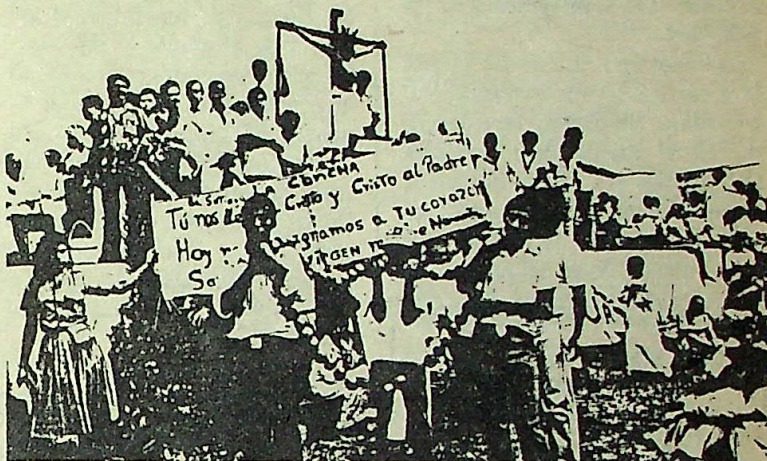
Celebración religiosa llamada "Consagración de Nicaragua a la Virgen María".